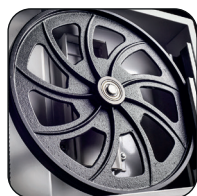
Volants en fonte d'acier équilibrés