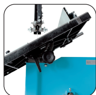
Table inclinable à 45°