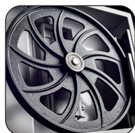
Volants en fonte d'acier équilibrés